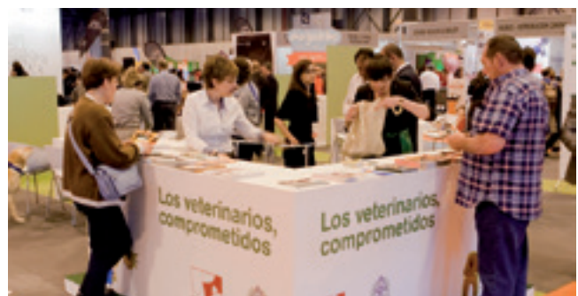
El stand de "Los veterinarios comprometidos" recibió numerosas visitas de los propietarios de mascotas que acudieron a la Feria.