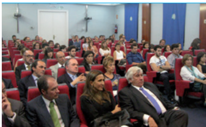
Profesores, coordinadores y los alumnos de esta edición del MSA acudieron a la convocatoria.