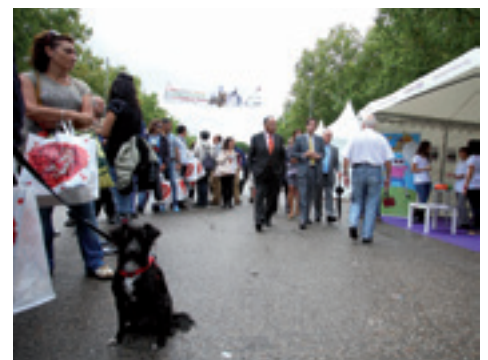
Los ciudadanos que se acercaron al stand del Colegio de Veterinarios recibieron información sobre cuidados sanitarios de las mascotas, identificación, tenencia responsable y salud pública.