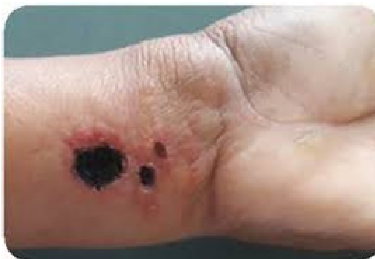
Figura 2. Caso de carbunco cutáneo o ántrax en humano.