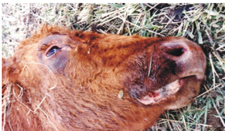
Figura 3.2. Caso “probable” de muerte por carbunco en bovino. Se observa la existencia de hemorragias en los orificios nasales y olerares.

Sólo podremos considerar como casos confirmados si se aísla la bacteria a partir de las muestras tras la realización de las pruebas de laboratorio indicadas.