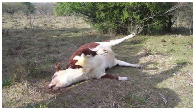
Figura 3.1. Caso “sospechoso” de muerte por carbunco en bovino. Se observa una hinchazón característica en los cadáveres de animales infectado por B. anthracis .

La enfermedad del carbunco no presenta síntomas patognomónicos. Cuando observamos casos de muerte súbita en algunos animales del rebaño en pastos potencialmente contaminados por B. anthracis , podemos clasificarlos como sospechosos . En el caso de que los animales afectados o muertos presenten una serie de signos característicos asociados a la enfermedad (hinchazón, hemorragia oscura por orificios naturales, septicemia, edema subcutáneo o muscular...), se considerarán como casos probables . Algo que puede ayudar a establecer la infección de B. anthracis como causa de la muerte es un rigor mortis ausente o incompleto, y una descomposición rápida del cadáver.